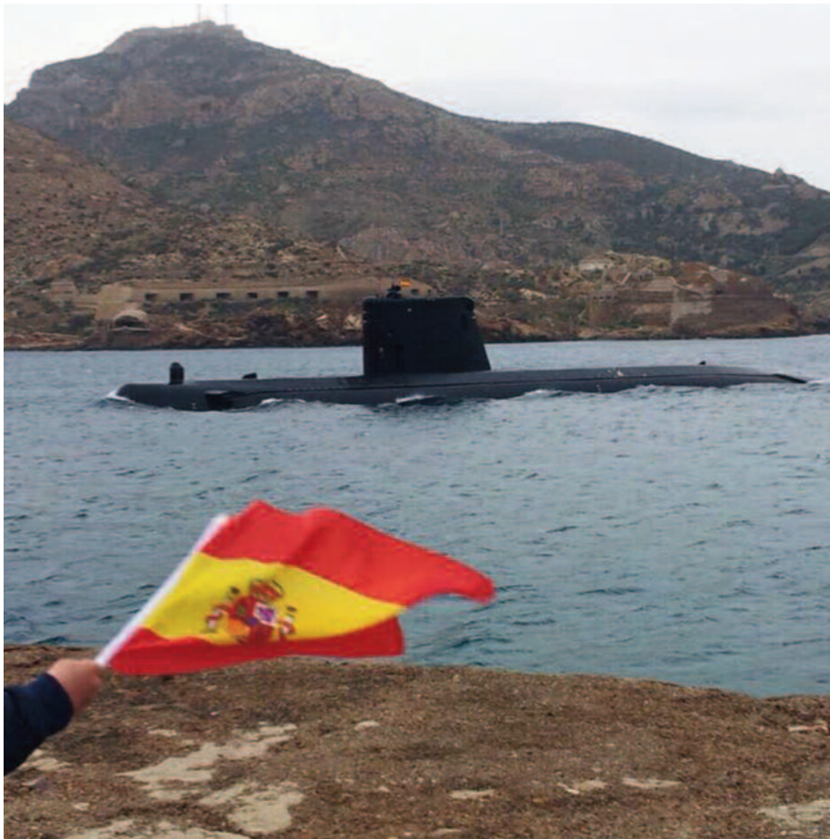
Submarino Galerna entrando en el puerto de Cartagena.

(S-73) y el Tramontana (S-74)—, que fueron entregados a la Armada en los años 80, por lo que podemos afirmar que con sus más de 30 años de servicio ya son veteranos.