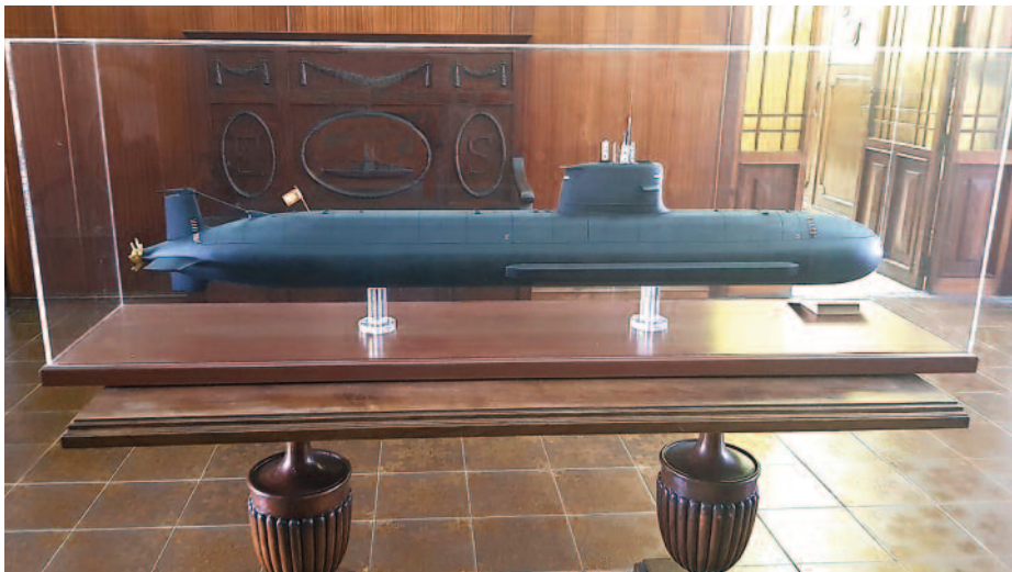
Maqueta del submarino S-80 Plus. (Autor: Francisco Payán Aguilar).

del proyecto. En cualquier caso, lo importante es mirar al futuro; lo cierto es que cuando veamos a flote el primer S-80 Plus , conseguiremos pertenecer al distinguido club de los países capaces de construir submarinos, lo cual no pueden decir muchos y será un auténtico orgullo. Como recordó la ministra de Defensa en funciones en su visita a las instalaciones de la Armada en Cartagena el pasado 25 de septiembre, estos proyectos «suponen innovación, ciencia y tecnología».